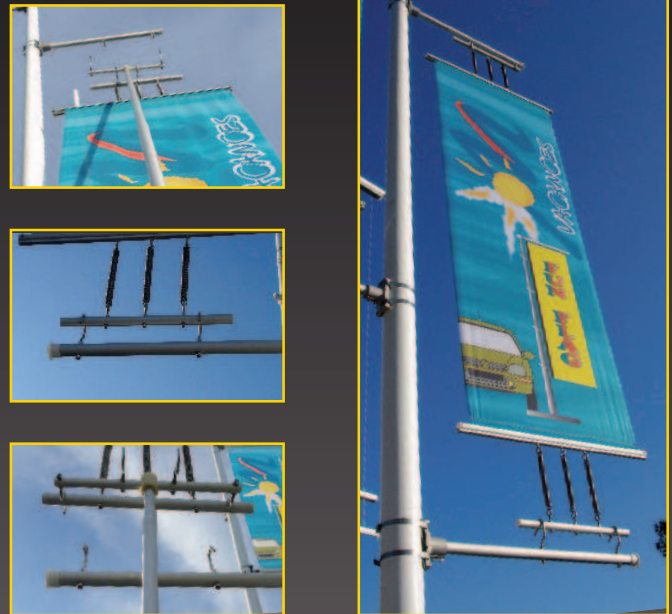
Perche télescopique à crochets, pour changement de bannière jusqu'à 5 m du sol. Dimensions maxi : 80 x 250 cm en toile maillée ou bâche.